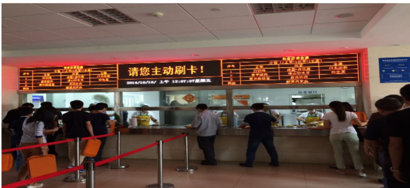
住宿环境：（翔安厂区）